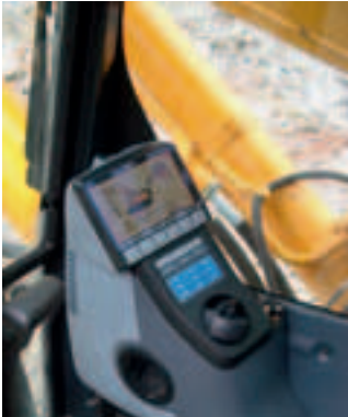
Monitor am Fahrerplatz

Der Einsatz moderner Baumaschinen hat wesentlichen Anteil daran, dass Bauarbeiten zunehmend produktiver, aber auch ergonomischer ausgeführt werden. Das auf Baustellen oft enge räumliche Zusammenwirken von Mensch und Maschine birgt jedoch auch Gefahren. Mangelnde Sicht ist dabei einer der Aspekte, die immer wieder zu Unfällen führen. Mit Hilfe neuer Anforderungen in Normen und der Präventionskampagne „Risiko raus!“ rückt die BG BAU dem Problem zu Leibe.